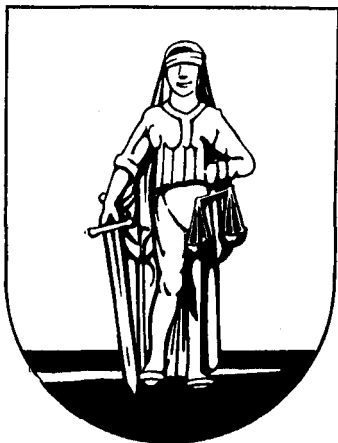
Het tegenwoordige wapen van Beek-L.