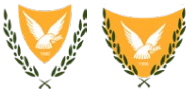
Voorbeeld van een beeldvullend en losstaand object toegepast op het wapen van Cyprus (links)

In het bovenstaande bleek al dat deze categorie en de volgende veel met elkaar te maken hebben. Drie emblemen zijn van Afrikaanse landen, drie van (Midden-, Noord- en Zuid-)Amerikaanse, twee van Aziatische en een van een Europees land. Gemeenschappelijk hebben ze de krans die de emblemen omgeeft. Het onderscheid dat ik maak is dat in deze categorie de centrale voorstelling los in de krans staat, terwijl de krans in de tweede categorie de centrale voorstelling geheel insluit. De centrale voorstelling is daar beeldvullend. Je zou kunnen zeggen dat je de centrale voorstellingen in deze categorie los kunt maken van de krans en dat je dan weer een zelfstandig embleem krijgt. Bij de emblemen in de volgende categorie geeft de krans het embleem zijn coherentie, zonder