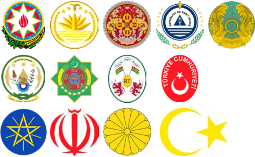
Landen: Azerbeidzjan, Bangladesh, Bhutan, Kaapverdië, Kazachstan, Rwanda, Turkmenistan, Togo, Turkije, (Ethiopië, Iran, Japan, Libië)

doorbroken wordt door een soort krans of lint die de verder wel geheel ronde compositie (gedeeltelijk) omgeeft. Bij Rwanda staat het lint net buiten de krans. Met het embleem van Rwanda begeben we ons al langzaamaan naar de allerlaatste categorie van dit onderzoek, en het kan dan ook weer gezien worden als een soort overgangsembleem. Maar alvorens over te gaan naar deze categorie, kijken we eerst nog even naar vier bijzondere emblemen.