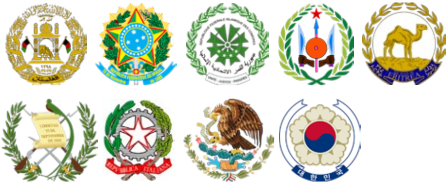
Landen: Afghanistan, Brazilië, Comoren, Djibouti, Eritrea, Guatemala, Italië, Mexico, Zuid-Korea

In het bovenstaande bleek al dat deze categorie en de volgende veel met elkaar te maken hebben. Drie emblemen zijn van Afrikaanse landen, drie van (Midden-, Noord- en Zuid-)Amerikaanse, twee van Aziatische en een van een Europees land. Gemeenschappelijk hebben ze de krans die de emblemen omgeeft. Het onderscheid dat ik maak is dat in deze categorie de centrale voorstelling los in de krans staat, terwijl de krans in de tweede categorie de centrale voorstelling geheel insluit. De centrale voorstelling is daar beeldvullend. Je zou kunnen zeggen dat je de centrale voorstellingen in deze categorie los kunt maken van de krans en dat je dan weer een zelfstandig embleem krijgt. Bij de emblemen in de volgende categorie geeft de krans het embleem zijn coherentie, zonder