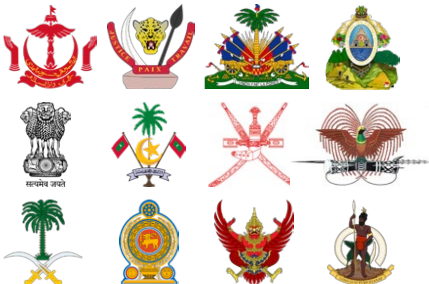
Landen: Brunei, Democratische Republiek Congo (DRC), Haïti, Honduras, India, Malediven, Oman, Papoea-Nieuw-Guinea, Saoedi-Arabië, Sri Lanka, Thailand, Vanuatu

En daarmee zijn we aangekomen bij de allerlaatst overgebleven twaalf emblemen! Enerzijds is dit een restcategorie, maar anderzijds hebben de emblemen bij nadere beschouwing zeker gemeenschappelijke kenmerken. De naam van de categorie karakteriseert naar mijn idee het belangrijkste kenmerk: “ge-groepeerd rond een object”. Zeven landen liggen in Azië, twee in (Midden-) Amerika en de Caraïben, twee in Oceanië en een in Afrika. Sommige emblemen uit deze categorie bestaan uit één enkel object. Een duidelijk voorbeeld hiervan is Thailand (een Garoeda, een mythisch wezen uit het Boeddhisme en Hindoeïsme). 33 Ook het embleem van India reken ik hiertoe. Door de dikke omlijning van het embleem van Sri Lanka zou je geneigd zijn ook dit embleem tot deze subgroep te rekenen. Bij nadere beschouwing echter, blijkt het embleem te bestaan uit losse elementen waardoor het een soort overgang vormt met de tweede soort emblemen; zij die bestaan uit meerdere objecten. Ook hier zien we weer een sterke variatie. De emblemen van Oman en Saoedi-Arabië bijvoorbeeld, zijn nog altijd vrij eenvoudig omdat ze bestaan uit en beperkt aantal elementen. Haïti en Honduras daarentegen hebben emblemen die een ware tentoonstellingen zijn van allerlei schijnbaar bij elkaar geraapte objecten. Verderop kom ik nog terug op met name de morfologie van de emblemen in deze categorie.