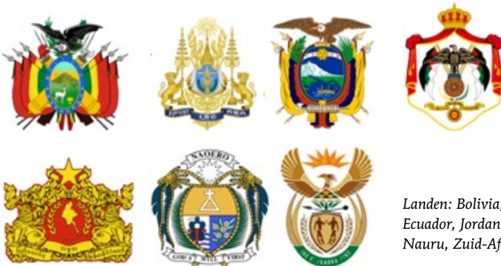
Landen: Bolivia, Cambodja, Ecuador, Jordanië, Myanmar, Nauru, Zuid-Afrika

Deze laatste categorie is een soort vergaarbak van overige schijn-heraldische emblemen die in het kader van dit onderzoek niettemin fascinerend zijn. Geen Europese landen in deze categorie, maar wel drie Aziatische, twee Zuid-Amerikaanse, een Afrikaans en een uit Oceanië. Deze zeven emblemen hebben een plek gekregen in deze categorie omdat zij enerzijds op het eerste oog een heraldische compositie lijken te hebben, of omdat zij anderzijds weliswaar een schild (of iets wat daarop lijkt) hebben als kernelement, maar dat de uitvoering verder niet heraldisch te noemen is. Sommige zijn dus semi-heraldisch en andere heraldiserend. Misschien is het embleem van Jordanië wel het duidelijkste voorbeeld van semi-heraldiek. We zien een gekroonde baldakijn zoals we die ook hebben gezien in de laatste categorie van de heraldische wapens. Op de plek waar we het schild verwachten zien we hier echter een adelaar staande op een gedeeltelijk zichtbare wereldbol, 28 die is geplaatst achter een schild