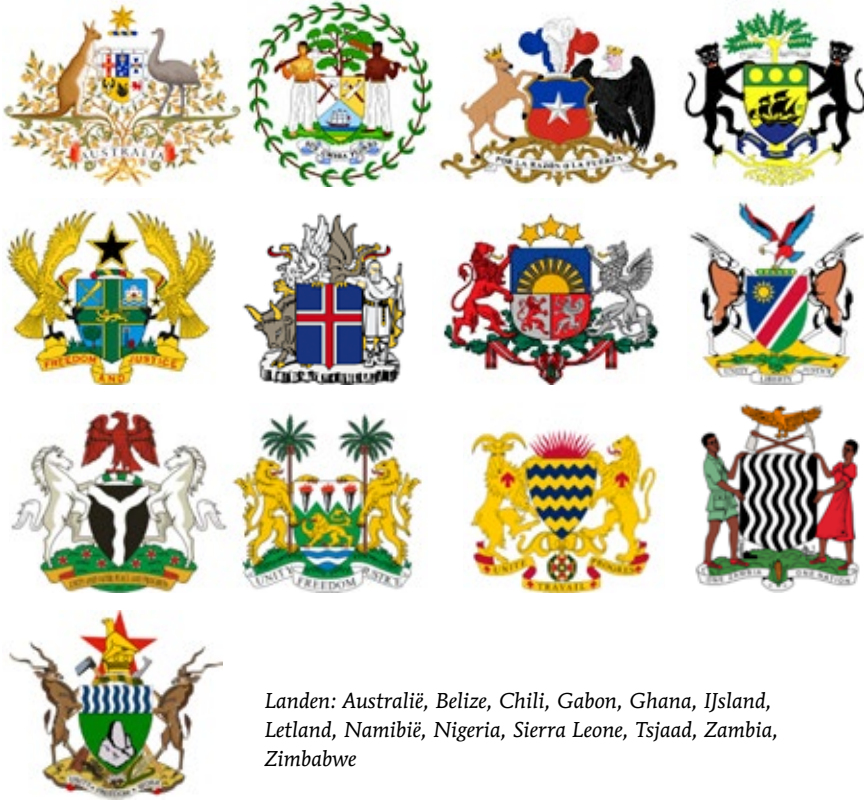
Landen: Australië, Belize, Chili, Gabon, Ghana, IJsland, Letland, Namibië, Nigeria, Sierra Leone, Tsjaad, Zambia, Zimbabwe

zeer geslaagde- wapen van Gabon, staan de schilhouders gedeeltelijk op het lint met het motto en gedeeltelijk op een voetstuk. Gabon heeft verder met Tsjaad gemeen dat het een Franse ex-kolonie is en dat het wapen is ontworpen door een heraldicus. 17 Belize valt op omdat het als enige in deze categorie (en als enige van de wapens met schilhouders) omringd wordt door een krans van bladeren. Australië wil ik even noemen vanwege het spijtige feit dat het helmteken boven het schild zweeft. Ook bij wapenontwerpen moeten we ervan uitgaan dat zij enigszins onderhevig zijn aan de normale wetten van de zwaartekracht! Bovendien is de schildindeling erg druk en “overwoekert” het decoratieve bladerwerk een beetje de heraldische compositie. IJsland valt op omdat het als enige land ter wereld zowel mensen als dieren en in totaal maar liefst vier schilhouders in het wapen heeft. Als dat de veiligheid van het land nog niet waarborgt, dan weet ik het niet meer!