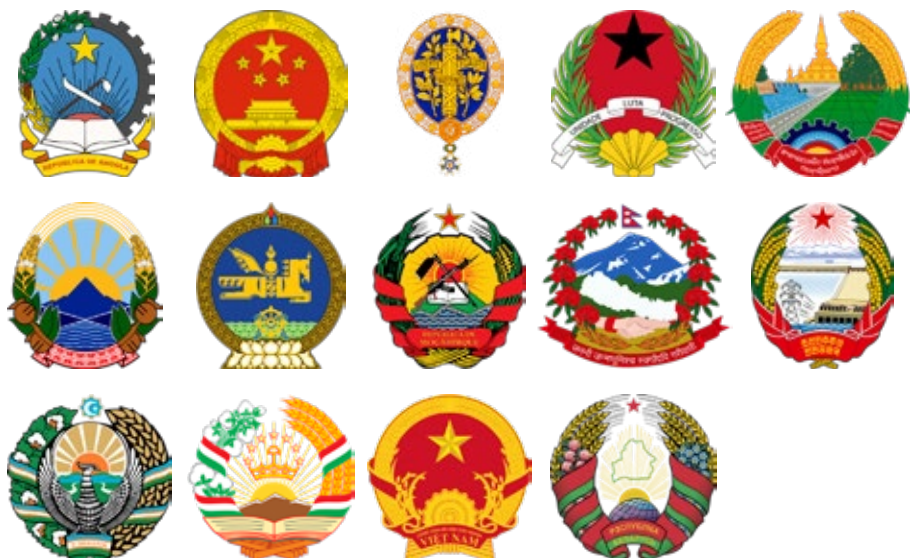
Landen: Angola, China, Frankrijk, Guinee-Bissau, Laos, Macedonië, Mongolië, Mozambique, Nepal, Noord-Korea, Oezbekistan, Tadzjikistan, Vietnam, Wit-Rusland

De tweede categorie emblemen die omgeven zijn door kransen omvat de emblemen die ik als bijnaam “revolutionaire wapens” of “revolutionaire heraldiek” heb meegegeven. Waarbij wapens en heraldiek op het eerste oog misplaatst kunnen klinken. We hebben hier echter te maken met een groep van een veertiental emblemen die onmiskenbaar allemaal iets met elkaar te maken hebben: ze passen binnen een traditie met een eigen vormtaal. Natuurlijk heeft dit te maken met de politieke achtergrond van de betreffende landen: communistische en socialistische regimes. Zeker in de tijd van de Koude Oorlog gold deze communistische heraldiek als een tegenhanger van de Westerse heraldiek zoals wij die gewend zijn. Een communistisch wapen is direct te herkennen aan een aantal terugkerende kenmerken. Ten eerste natuurlijk de krans, meestal bestaande uit specimen van de belangrijkste