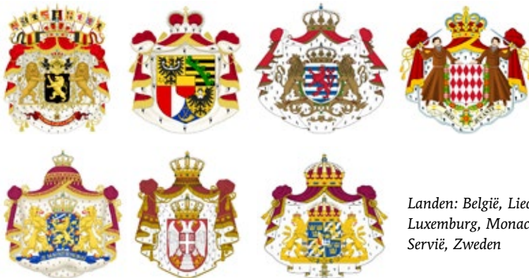
Landen: België, Liechtenstein, Luxemburg, Monaco, Nederland, Servië, Zweden