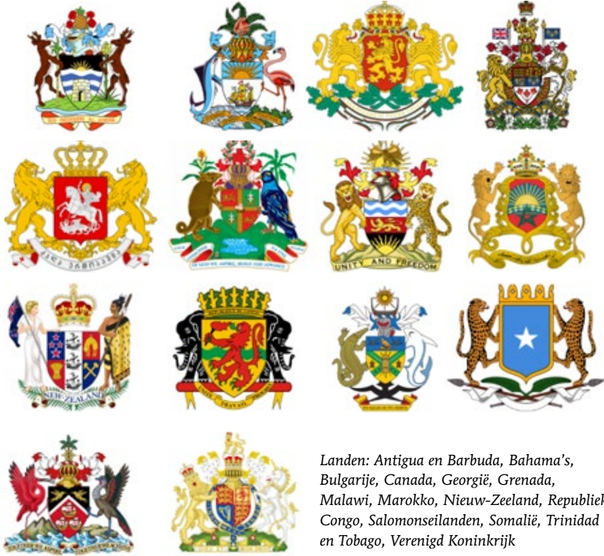
Landen: Antigua en Barbuda, Bahama's, Bulgarije, Canada, Georgië, Grenada, Malawi, Marokko, Nieuw-Zeeland, Republiek Congo, Salomonseilanden, Somalië, Trinidad en Tobago, Verenigd Koninkrijk