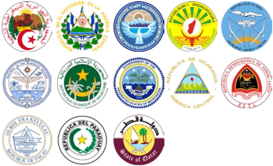
Landen: Algerije, El Salvador, Kirgizië, Madagaskar, Mali, Marshallen, Mauritanië, Micronesië, Nicaragua, Oost-Timor, Palau, Paraguay, Qatar

hier verder even onbesproken. Ik kom daar later nog uitgebreider op terug. Dertien landen, waaronder geen enkel Europees, voldeden aan deze criteria. We zien vier landen uit Afrika terug in deze categorie, drie uit zowel Azië als Oceanië, twee uit Midden-Amerika en een uit Zuid-Amerika. Het embleem van Kirgizië kan gezien worden als een soort overgang tussen de emblemen uit de vorige categorie en deze. Er is sprake van een kruis, die ongeveer de helft van de buitenrand inneemt, de andere helft wordt ingenomen door tekst. En hoewel het symbool tussen de kruisen niet beeldvullend is, kan enige regionale beïnvloeding toch niet uitgesloten worden. Hetzelfde zien we in feite bij Madagaskar. Ook hier wordt de tekst afgewisseld met een kruis. Opvallend zijn verder de symbolen van El Salvador en Nicaragua. Feitelijk zijn deze driehoekig, een unicum in de wereld, maar door de tekst die in een cirkel rond het symbool staat, horen ze toch in deze categorie. Denk de tekst weg en El Salvador was in de eerste categorie van de niet-heraldische symbolen terecht gekomen.